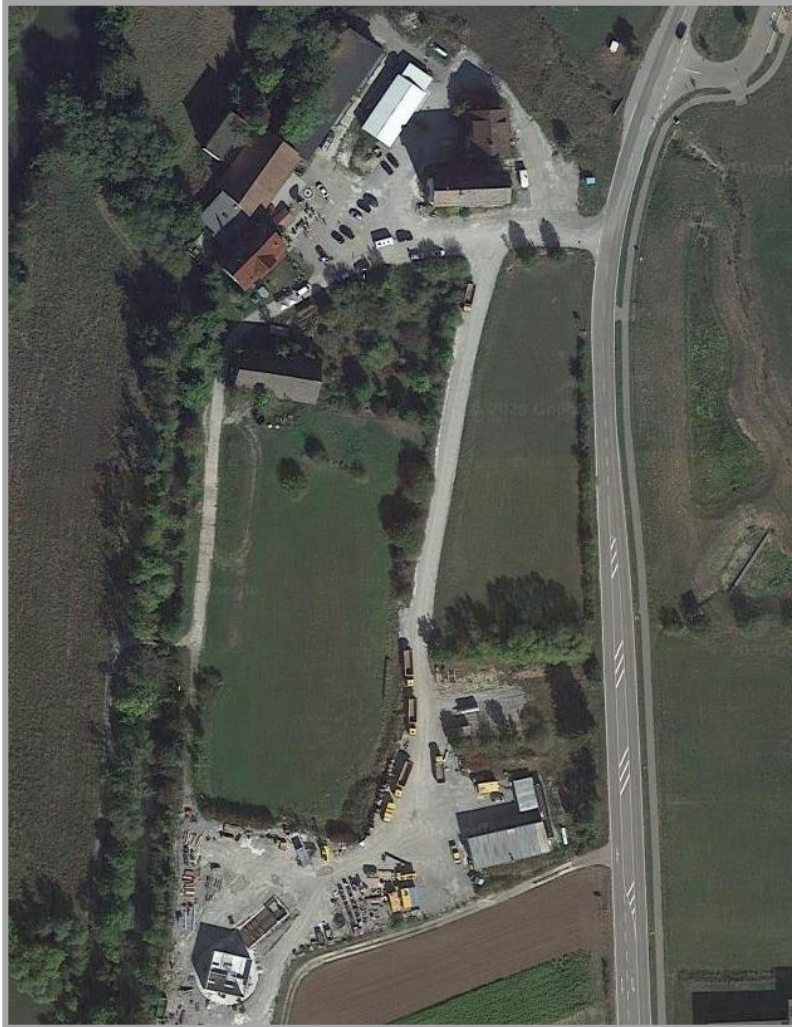
Bild 4: Luftbild mit Bestand

nach Gaildorf und im Süden Richtung Sulzbach-Laufen. Dabei liegt nordöstlich des Plangebiets die Bushaltestelle „Abzweigung Münster“ als Buswendeanlage mit Verbindungen Richtung Gaildorf ZOB und Untergröningen. Unmittelbar nördlich davon erfolgt der straßenmäßige Anschluss des Stadtteiles Münster, der dort auch in Richtung Nordosten angrenzt und durch eine gemischte Bebauung geprägt ist. Östlich des Geltungsbereiches grenzen die Wiesenflächen des hier nur leicht ansteigenden Rennichbachtals mit renaturiertem Bachlauf und Regenrückhaltebecken an. Die südlich angrenzenden Flächen werden meist landwirtschaftlich intensiv genutzt. Im südöstlichen Anschlussbereich bestehen die gewerblichen Bauten des Gewerbegebiets Münster, welche ebenfalls über die Bundesstraße 19 angebunden sind.